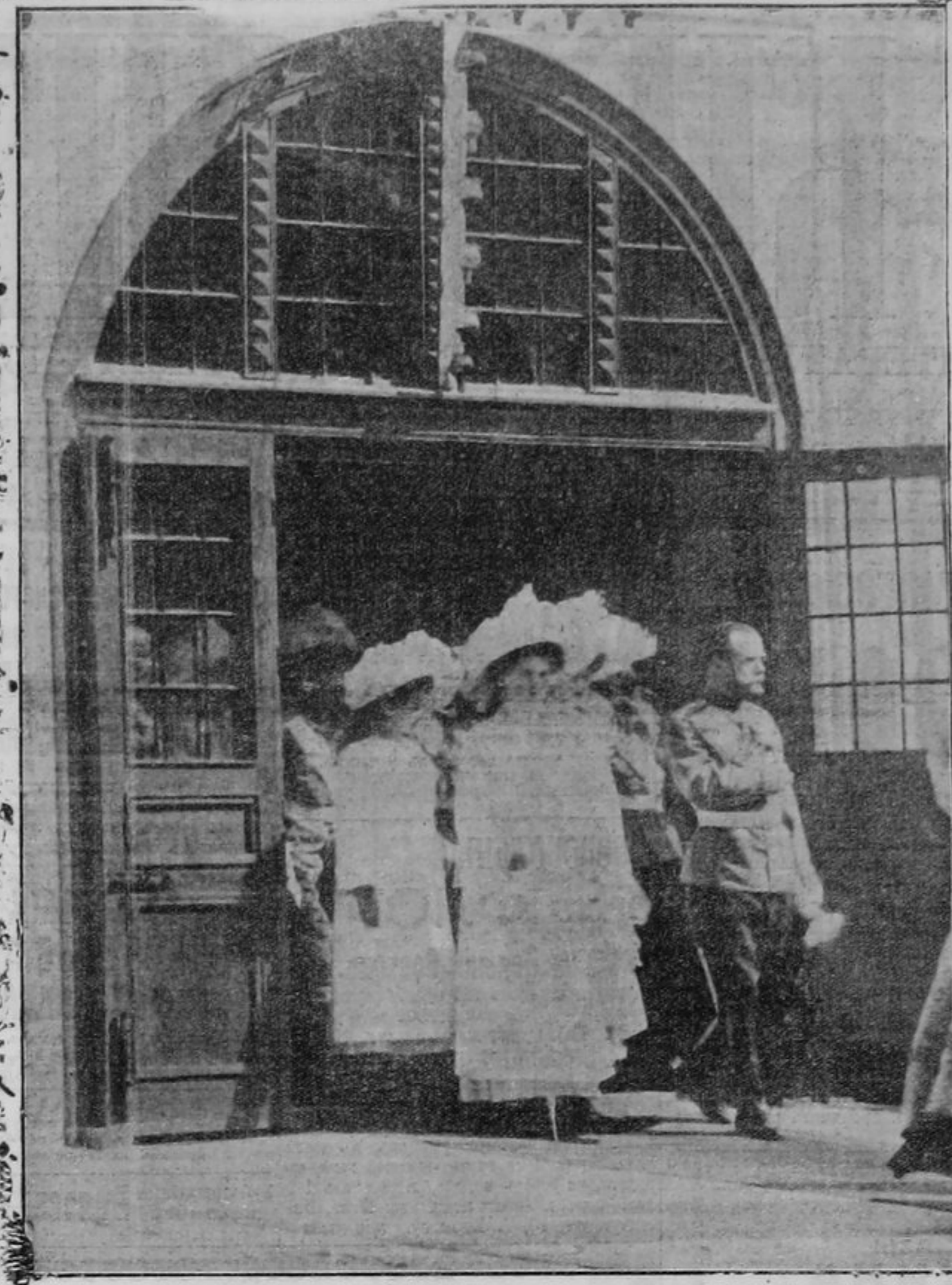
Выходъ Государя Императора съ Великими Княжнами изъ Михайловскаго монастыря.